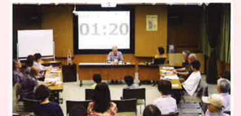
図書館読書会—ビブリオバトル方式—