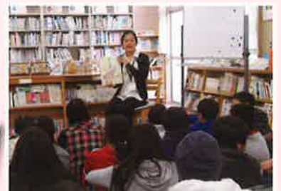
ブックトーク学校訪問