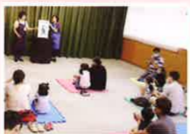
図書館 2020・2021年コロナ禍