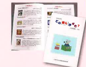
小学校新1年生に進呈するブックリスト