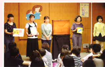
三芳町子どもの読書環境サポート隊 ほんのむし

*三芳町立図書館は、文部科学省から、「子どもの読書活動優秀実践図書館」として、2002年と2014年の2度にわたり表彰されています。