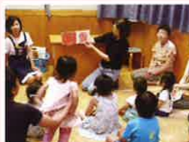
図書館 ぐりぐらタイム