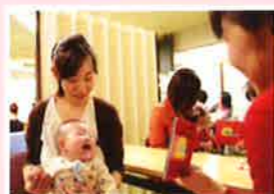
図書館 ブックスタート