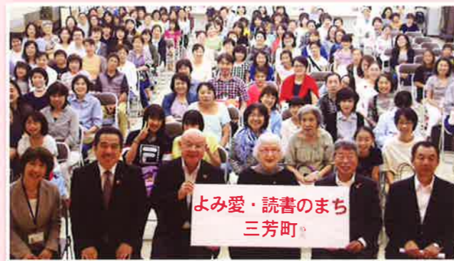
「よみ愛・読書のまち宣言」記念式典で、角野栄子先生講演会 2016年6月5日