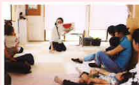
子育て支援センター 絵本講座